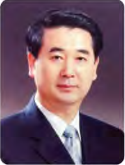
의장 노 승 중