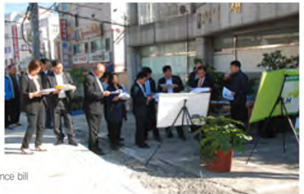
현장방문활동 touring sites 现场访问活动