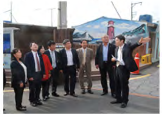
현장방문활동 touring sites 现场访问活动