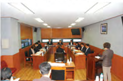
조례안 등 심사 evaluation of ordinance bill 条例安等 审查