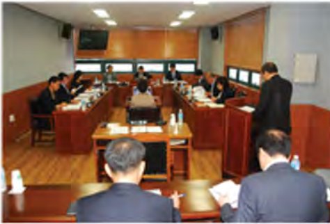
조례안 등 심사 evaluation of ordinance bill 条例安等 审查