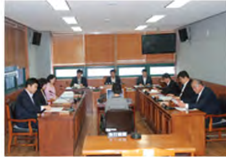
의사일정 심사 evaluation of the agenda 议事日程 审查